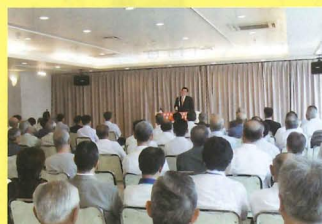
▲日本と地域の未来を熱く語る