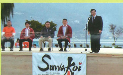
▲若い力で、諏訪湖よさこい