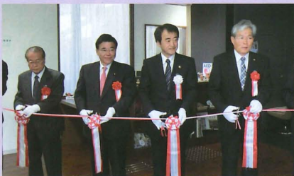
▲市立岡谷美術考古館開館を祝いテープカット