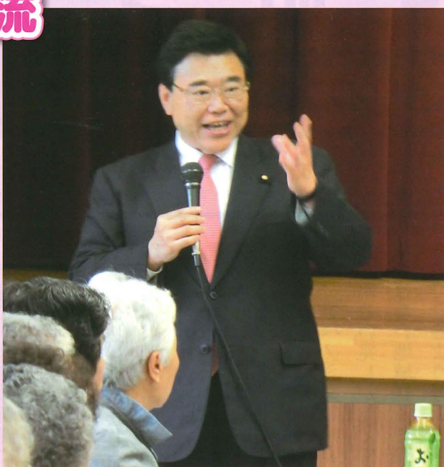
▲ますますお元気で。(上は岡谷市、左上は富士見町敬老会)