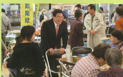
▲▼収穫の秋を迎え各地で農業祭が行われた。 誰とでも気さくに語り合い、触れ合う (上は岡谷市、下は諏訪市)