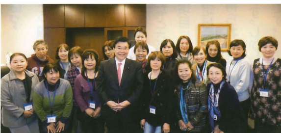
▲厚生労働委員長室にて

1 各地で後援会新年会が開かれます。政界のニューリーダーとして大活躍中の後藤代議士のエネルギーあふれる生の声を聞いていただくよい機会です。お誘い合わせの上、ぜひご参加ください。 2 後藤代議士は、この一年余りで、法務副大臣、衆議院の常任委員会である厚生労働委員会の委員長と、四期当選組のトップを切つてステップアップしています。次には、次回当選後の大臣が期待されます。今後とも力強いご支援をお願いします。 3 ミニ集会は活動の原点です。ミニ集会を開いていただければ事務局までご連絡ください。よろしくお願ひ申し上げます。