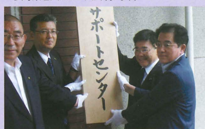
▲諏訪更生保護センター開所式