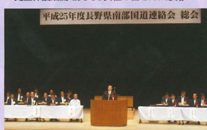
▲長野県南部国道連絡会総会(木曾町)