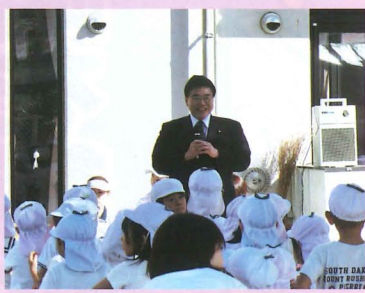
▲保育園の運動会で子供たちを励ます