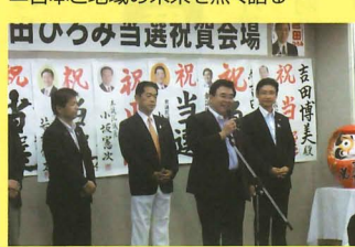
▲参院選「ありがとうございました」