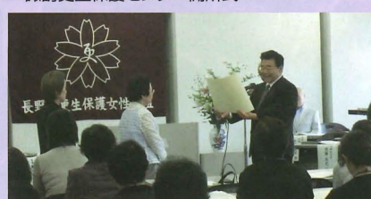
▲長野県更生保護女性連盟リーダー研修会において 更生保護活動を支える女性の皆さんに感謝