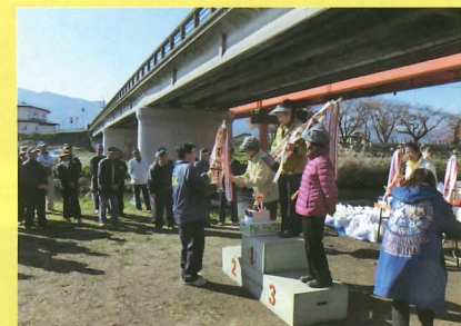
▲▼秋晴れのもと、大勢のご参加をいただき各地でマレットゴルフ大会(上は諏訪市、下は塩尻市)