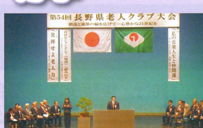
▲長寿社会における老人クラブの活躍に期待 長野県老人クラブ大会(茅野市)