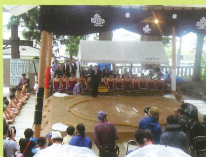
▲長野県無形民俗文化財諏訪大社上社十五夜奉納相撲