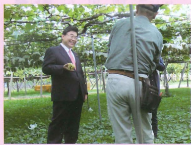
▲日本一のぶどう、ワイン産地へ(塩尻市)