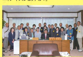
▲後援会バス旅行(副大臣室)