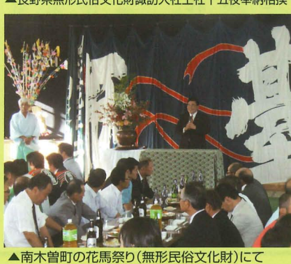
▲南木曾町の花馬祭り(無形民俗文化財)にて