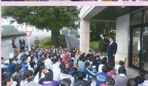
▲熱心に聞き入る子供達(国会見学)