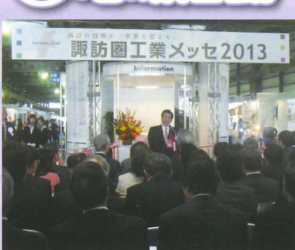
▲「ものづくり」は地域産業の基盤 諏訪圏工業メッセ開会式