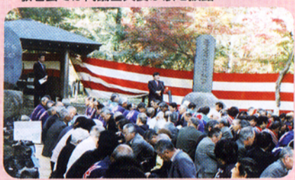
▲深まる秋、観楓会で交流(岡谷市)