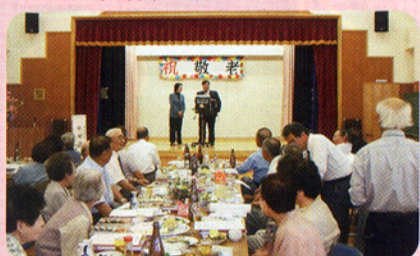
▲敬老会では代議士夫妻が歌を披露