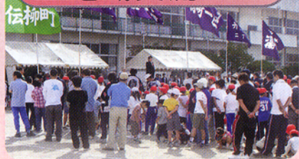
▲秋には各地の運動会に駆けつけた。