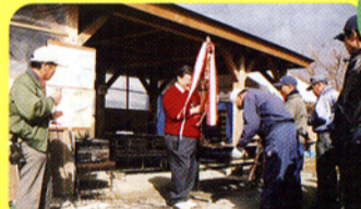
▲岡谷市マレット大会の表彰式