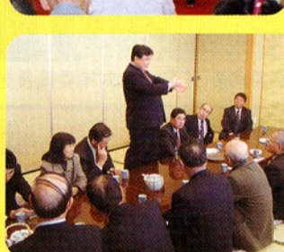
▲各地で熱く政策を語る。