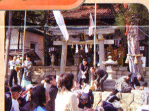
▲南木曾町田立 花馬まつり