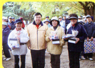
▲塩尻市マレット大会女性ベスト3の方々