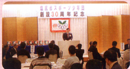
▲スポーツ少年団のお祝いの会にて