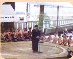
▲伝統ある十五夜相撲神事(諏訪大社)