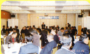
▲塩尻市のゴルフコンペ後の懇親会。今年で7回目を数えました。