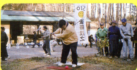
▲茅野市・原村・富士見町合同マレット大会の始球