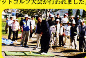
▲マレットゴルフ始球式(岡谷市)