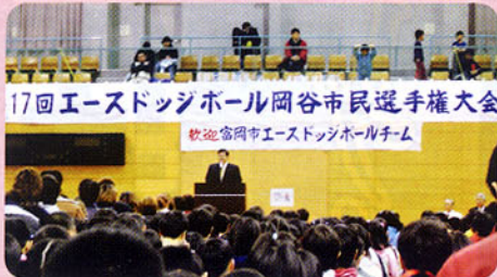
▲エースドッジボール大会開会式(岡谷市)