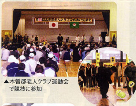
▲木曾郡老人クラブ運動会で剣技に参加