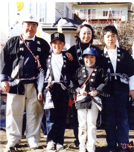
▲後援会御宿前にて(御柱祭)

◎新年会が各地で開かれます。多くの皆さんに代議士の改革への思いや、わかりやすく理論的な政策論を直接お話しできる絶好の機会です。お誘い合わせの上是非おいでください。 ◎ミニ集会は代議士の活動の原点です。東京の激務にもかかわらず代議士もミニ集會を心待ちにしています。事務所までご連絡をください。 ◎後援会拡充の一年としましょう。