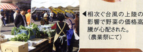
◀相次ぐ台風の上陸の影響で野菜の価格高騰が心配された。(農業祭にて)