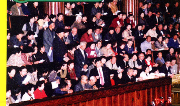
▲議事堂内で説明をする代議士

2004年12月1日、諏訪地域後援会主催の国会見学旅行が開催されました。バス8台を連ね360人が国会を見学。椿山荘での昼食会の後、上野アメ横の散策等を楽しみました。