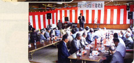
▲敬老会にてお年寄りの労をねぎらう