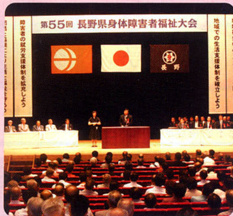
▲長野県身体障害者福祉大会