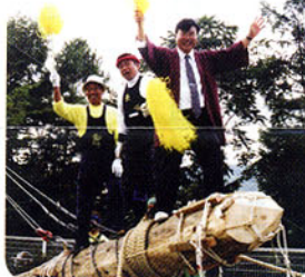
▲秋の茅野市の小宮祭り