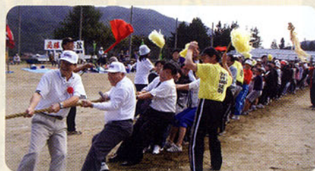
▲運動会の綱引きに飛び入り参加(塩尻市)