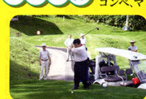
▲ゴルフ始球式(塩尻市)

2004年も各市町村において後援会ゴルフコンペ、マレットゴルフ大会が行われました。