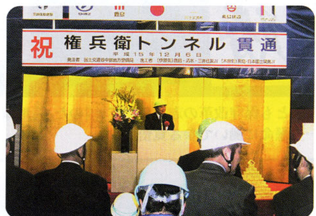
▲権兵衛トンネル工事貫通式