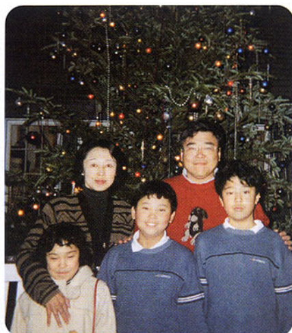
▲クリスマスツリーの前で。

◎選挙のたびに反省のタネはつきませんが、各々がんばった今回の難しい選挙、本当にありがとうございました。一人一人の純粋な気持ちに感謝します。 ◎後援会への入会カードの記入をされていない方は、選挙後でも宜しくお願ひ申し上げます。 ◎年末になってしまいましたので、新年会とともに当選祝賀会を各市町村毎に企画したいと思っております。 ◎もっと多くの皆さんに直接に代議士の話を聞いていただきたいと思っております。政策の深い理解や政治への思いがわかります。ミニ集会是代議士の活動の原点です。ミニ集會を開いていただける方は御連絡ください。