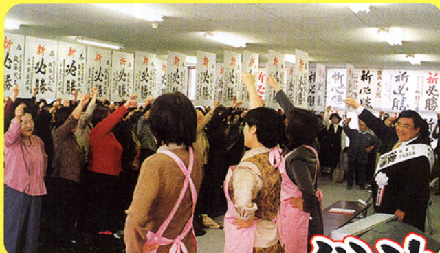
▲280名参加の「諏訪市女性の集い」