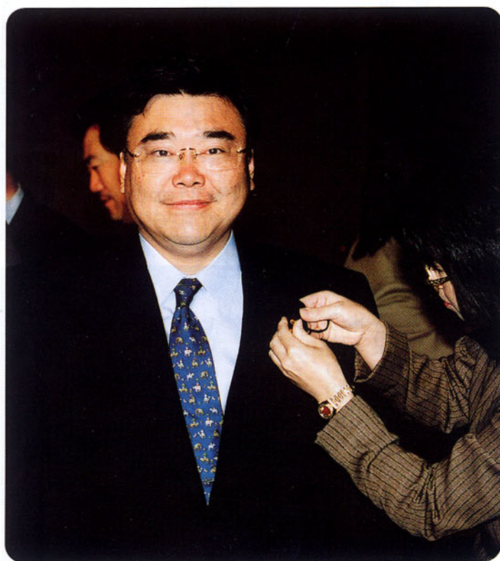
▲11月19日衆議院選後初登院。