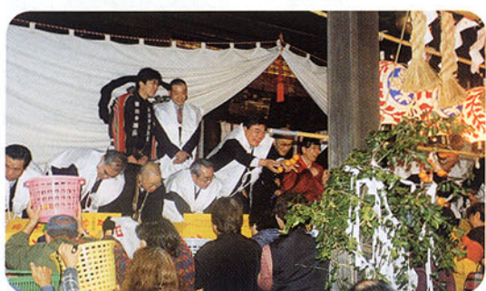
▲八剣神社秋季例大祭(みかん投げ)