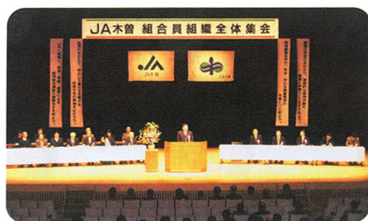
▲JA組合員組織全体集会