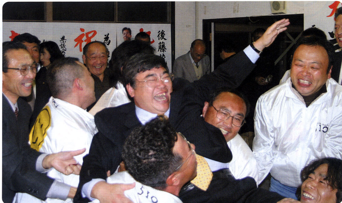
▲11月9日当選直後。(諏訪事務所) 青年部の仲間と胸上げされ気分は最高。