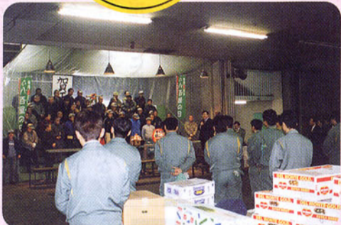
▲諏訪市公設地方卸売市場初市 経済不況を乗り越えるべく、力強い威勢の良い声が飛び交いました。