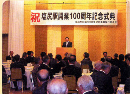
▲塩尻駅開業100周年記念式典 なつかしい駅の思い出。