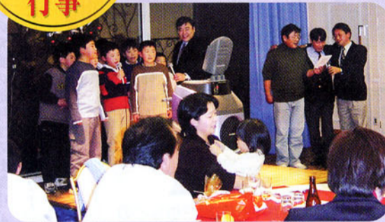
▲後援会連合青年部クリスマスパーティー 今年も恒例のクリスマスパーティーが家族同伴で盛大に開催されました。 子供たちと一緒にカラオケを歌う代議士。三人にも注目！