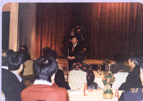
▲下諏訪後援会拡大役員会 忘年会を兼ね各地区で役員会が開かれました。