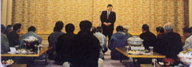
▲茅野市後援会小泉支部国政報告会