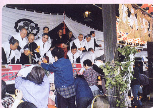
▲諏訪市八剣神社秋季例大祭「みかん投げ」