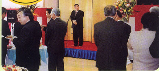
▲特別養護老人ホーム「紅林荘」竣工式