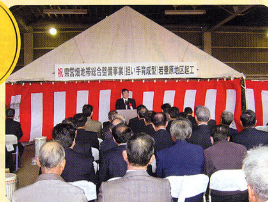
▲県営畑地帯総合整備事業「若い手育成型」岩手県地区起工式