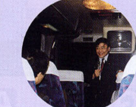
▲諏訪地区後援会親睦旅行 川崎大師・東京タワーを見学し、参加者から好評のホテルバイキングで 昼食をとりました。代議士は各バスに搭乗し、自慢の歌声を披露しました。