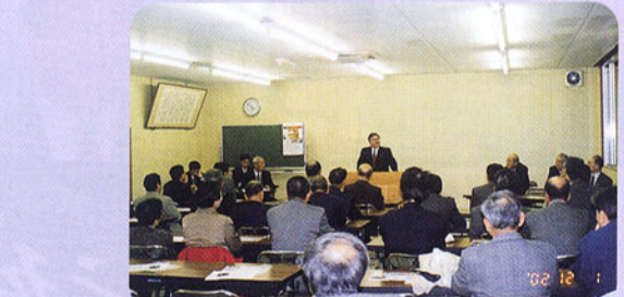
▲木曾郡大桑村国政報告会