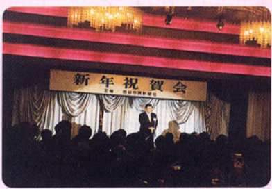
▲岡谷市民新聞社主催「新年祝賀会」