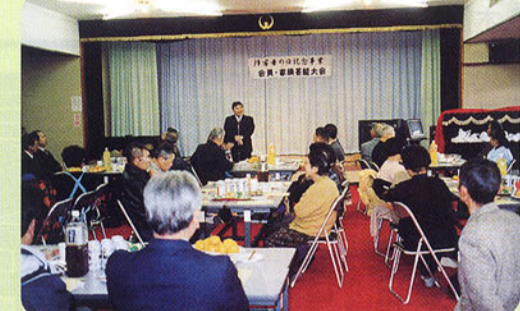
▲諏訪市身体障害者福祉協会「会員・家族芸能大会」誰でも参加できる開かれた社会を。