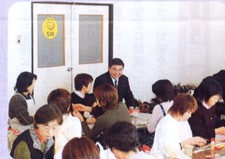
▲女性部手しごとの会 クリスマスツリーや正月のたわら作りなど、 数々の手しごとの挑戦中！