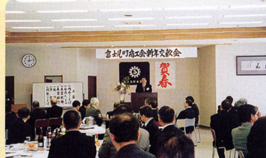
▲富士見町商工会新年交換会 中小企業金融の拡充を！