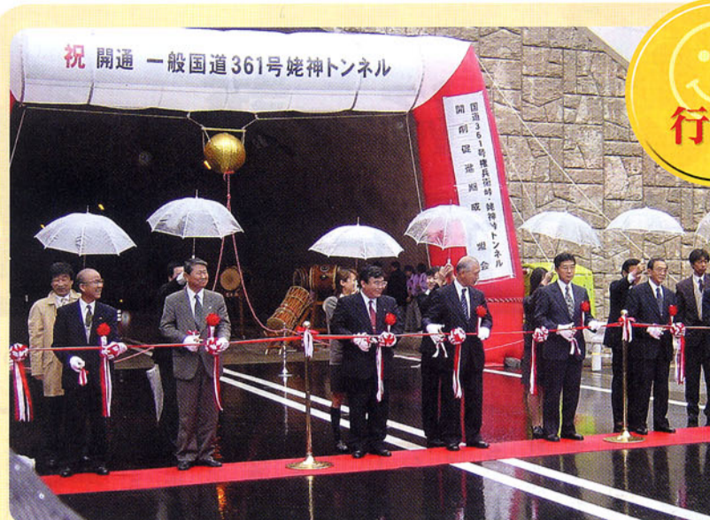
▲国道361号姥神トンネル開通式 真に必要な公共事業は推進します。