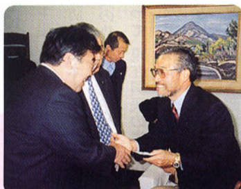
▲マラソン小出義雄監督特別講演会にて